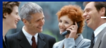
Vejen til de internationale regnskabsstandarder - IAS/IFRS